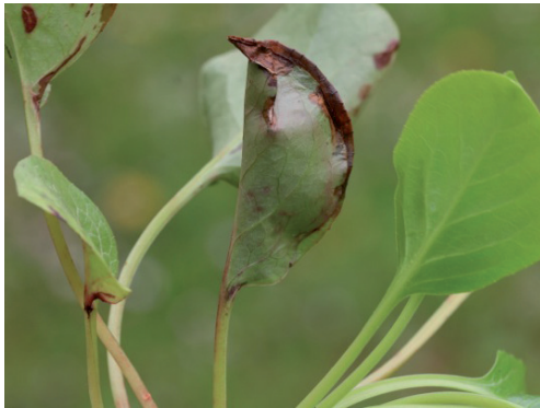
Abb. 1. Zusammengesponnenes Blatt.

Keywords: New country record, Switzerland, Argyroploce externa