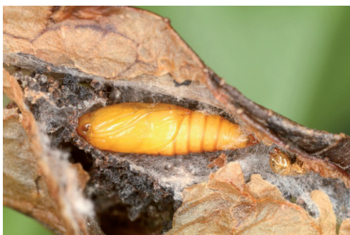
Abb. 4. Puppe.