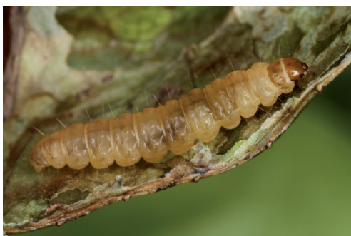
Abb. 3. Erwachsene Raupe.