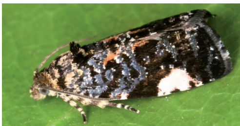
Abb. 5. Frisch geschlüpfte Argyroploce externa .

Die gesamte Raupenentwicklung erfolgt im selben Blatt (Abb. 1, 2); dort findet auch die Verpuppung statt (Abb. 4). Die Falter schlüpfen im Verlaufe des Monats Mai (Abb. 5).