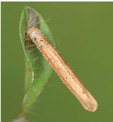
Abb. 1. Sack von Coleophora thymi M. Hering, 1942 an Thymus serpyllum .

Die Familie Coleophoridae (Miniersackträger) ist in der Schweiz mit etwas über 160 Arten vertreten (SwissLepTeam 2010, Schmid 2011). Diese sind jedoch nach äusseren Merkmalen nicht immer leicht unterscheidbar und eine Genitaluntersuchung ist für die sichere Determination vieler Arten unerlässlich. Die Schwierigkeit besteht aber darin, dass es bis heute kein Bestimmungswerk gibt, welches alle Arten der Region Mitteleuropa umfassend behandeln würde; vielmehr sind viele Genitalabbildungen in unzähligen Einzelpublikationen verstreut.