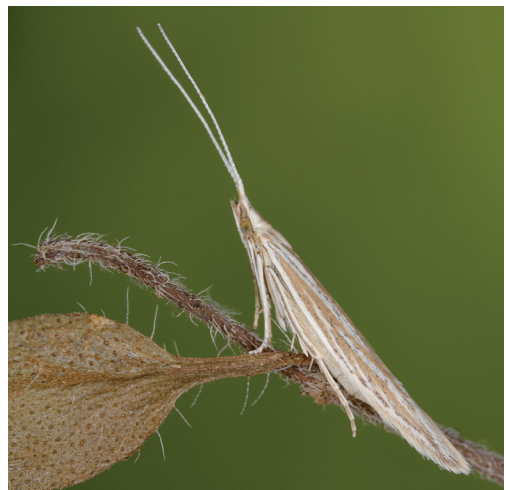
Abb. 2. Coleophora thymi , weibliches Tier.