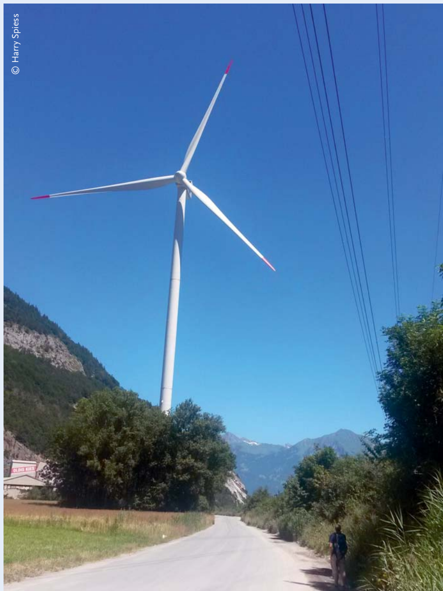
ABBILDUNG 1: Windkraftanlagen werden von der Bevölkerung eher akzeptiert, wenn sie dort errichtet werden, wo der Mensch bereits sichtbar in die Landschaft eingegriffen hat (etwa in der Nähe von Straßen, Übertragungsleitungen, Industrieanlagen, Rohstoffgewinnung etc.). Die Akzeptanzforschung untersucht derartige Bedingungen und Wechselwirkungen zwischen Technologie und der Gesellschaft. Im Bild die Windenergie-Anlage Haldenstein, Kanton Graubünden, Schweiz.