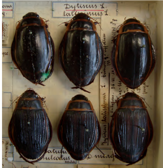
Abb. 1. Exemplare von Dytiscus latissimus Linnaeus, 1758 aus dem Naturhistorischen Museum Basel. (Sammlung Allenspach)

Basierend auf den historischen Fundorten wurden für die Felduntersuchungen verschiedene Gewässer im Kanton Zürich ausgewählt (Abb. 2).