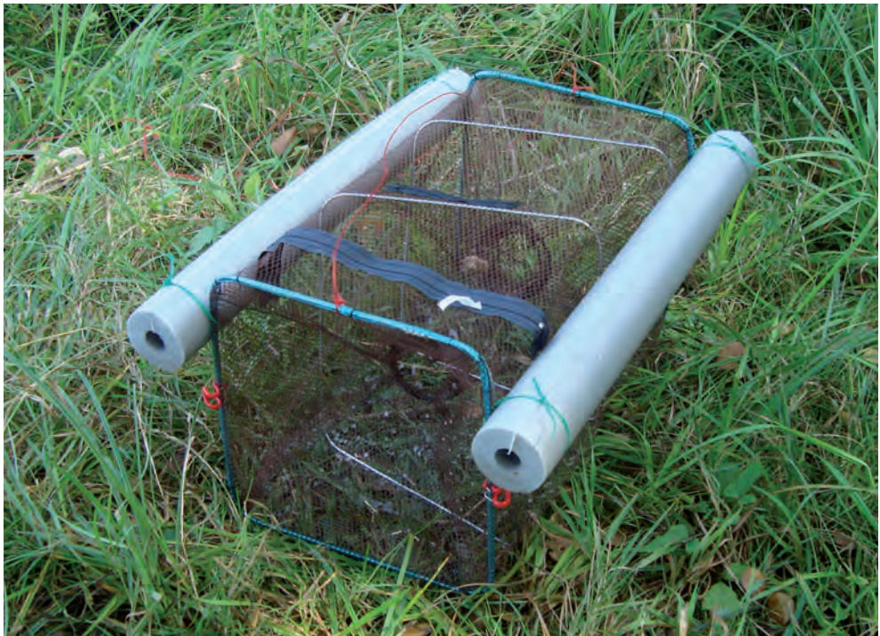
Abb. 3. Reusenfalle zur Untersuchung des Vorkommens von Dytiscus latissimus (Gebiet Hänsiried).

Die Gewässer wurden während 12 Tagen, vom 07.09. bis 18.09.2015, mithilfe von Reusenfallen (Abb. 3) auf ein Vorkommen von Dytiscus latissimus untersucht. In den beiden Katzenseen (K) wurden insgesamt 10, im Hänsiried (H) in zwei grossen