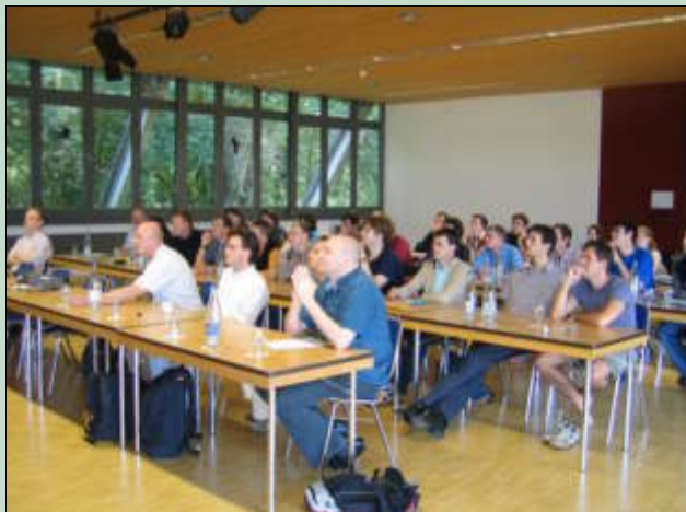
New and familiar faces at the traditional Gwatt meeting.

This meeting was the first contact with the NCCR Climate organization for the numerous new members of the 2nd Phase. In consequence the meeting aimed at making the next generation of PhD and postdoctoral researchers familiar with the overall NCCR Climate goals, both in research and interaction, and to help identifying the role and individual contributions of the new young researchers to the big NCCR picture. 38 PhD and postdoctoral researchers gath-