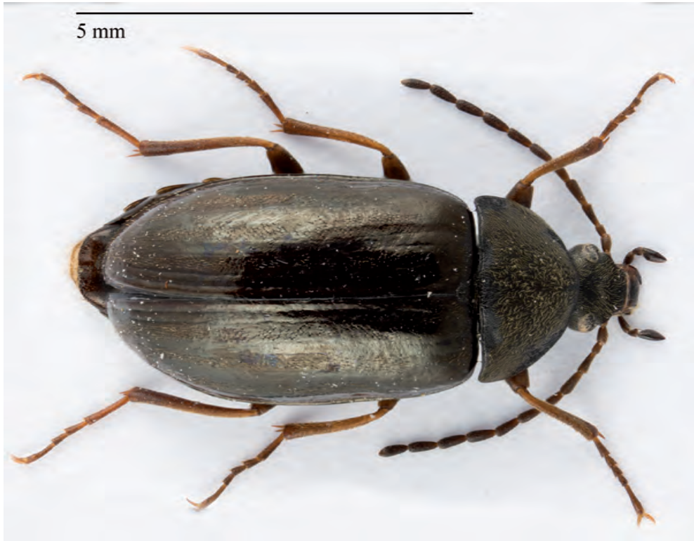
Fig. 1. Habitus de l'individu suisse d' Isomira costessii capturé en 2016 (6,6 mm).

Toutes les espèces d' Isomira citées, qu'elles aient été retenues ou non, font partie du sous-genre nominal (Novák & Pettersson 2008) alors qu'aucune espèce du sous-genre Heteromira Hölzel, 1958 n'était connue de Suisse. La capture d'un spécimen d' Isomira ( Heteromira ) costessii (Bertolini, 1868) en 2016 en Engadine constitue donc la première preuve de présence de ce sous-genre, et donc de cette espèce, dans notre pays. Cette découverte est présentée et mise en perspective avec les autres observations européennes connues.