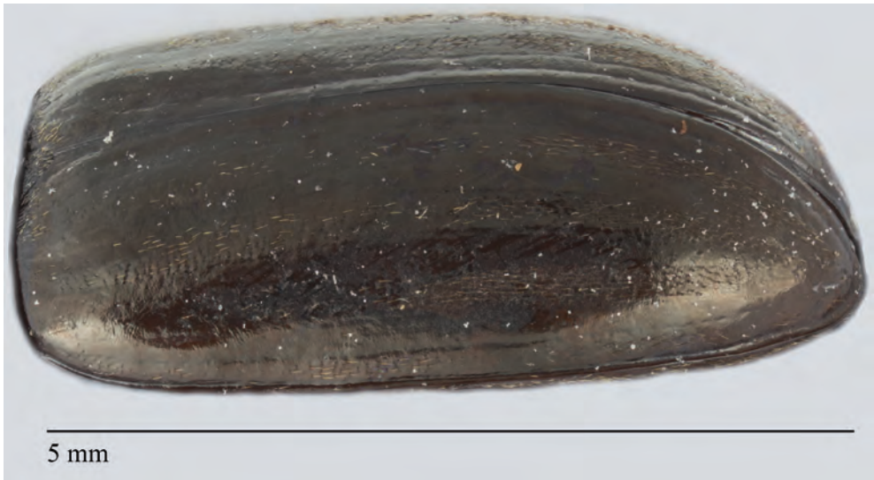
Fig. 2. Vue latérale des élytres d' Isomira costessii .

Représenté par deux espèces seulement, Isomira (Heteromira) costessii (Bertolini, 1868) et Isomira (Heteromira) moroi Hölzel, 1958, le sous-genre Heteromira se distingue aisément du sous-genre nominal par l'alternance d'intervalles élytraux pairs glabres et brillants et d'intervalles impairs ponctués et pubescents (Fig. 2). Les espèces du sous-genre nominal présentent au contraire des intervalles élytraux uniformément pubescents sur toute la surface des élytres.