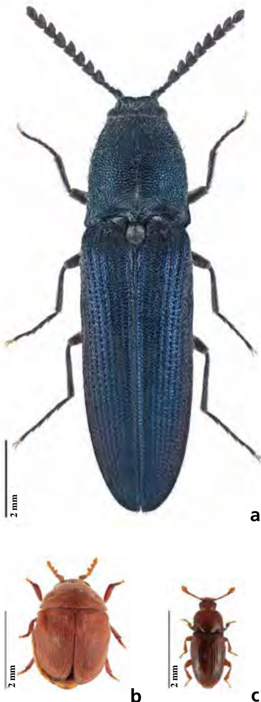
Fig. 2. Habitus de a) Limoniscus violaceus (individu d'Angleterre), b) Anitya rubens et c) Philothermus evanescens .

Au cours d'une prospection au-dessus du village de Fully, un chêne d'environ 60 cm de diamètre présentant une cavité haute et une cavité basse a été repéré (Figs 3a, b). Si la cavité haute était dépourvue de terreau (tronc creux), la cavité basse, accessible depuis le sol grâce à la légère inclinaison du tronc, en était remplie. Rapidement, un élytre violacé a été découvert et a immédiatement fait penser à L. violaceus . Une partie du terreau a donc été récoltée, ramenée au domicile du premier auteur puis soigneusement tamisée, avant d'être remise quelques jours plus tard dans la cavité. Ce tamisage a permis la découverte de restes supplémentaires de L. violaceus , confirmant la détermination supposée. Trois élytres gauches, deux élytres droits et surtout deux pronota caractéristiques (Fig. 3c) ont ainsi été mis en évidence, indiquant la présence d'au moins trois individus différents. Plus intéressant encore, une jeune larve a également été trouvée, attestant de la présence toujours