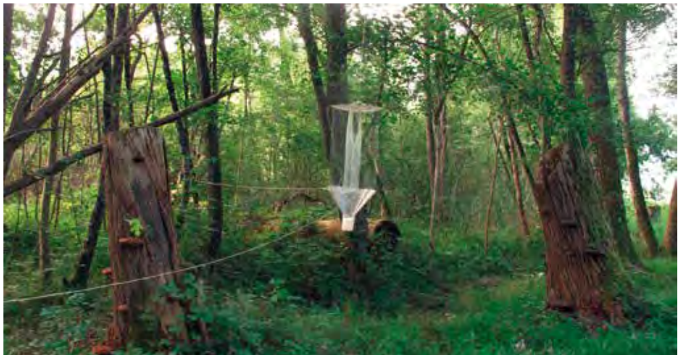
Fig. 1. Piège d'interception ayant permis la capture du spécimen de Philothermus evanescens à Noville.

Les auteurs ont continué à pratiquer en 2017 les méthodes de terrain qu'ils ont déjà utilisées abondamment par le passé. Ainsi, des pièges d'interception (Fig. 1) et des pièges attractifs aériens ont été placés dans de nombreux sites de Suisse. On se référera respectivement à Sanchez et al. (2015) et à Chittaro et al. (2013) pour de plus amples précisions concernant ces méthodes d'échantillonnages. Des recherches actives (chasse à vue, battage, fauchage, tamisage) ont également été menées ponctuellement en fonction des situations rencontrées.