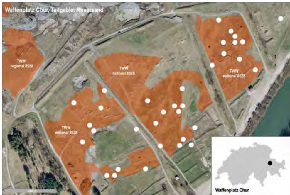
Abb. 2. Verteilung von Myrmeleotettix maculatus 2017 (weisse Punkte) im Untersuchungsgebiet Rheinsand, Wassenplatz Chur, Gemeinden Felsberg und Haldenstein (GR). Farblich markiert sind Trockenwiesen und -weiden von nationaler und regionaler Bedeutung.

Im Radius von 1 m rund um das markierte Zentrum des M. maculatus -Vorkommens dokumentierten wir an jedem der 34 Standorte die Vegetationsdichte mittels vertikaler Fotoaufnahmen und schätzten basierend darauf den Deckungsgrad der Krautschicht und der Moose/Flechten ab. Diese beiden Vegetationsparameter wurden deshalb gewählt, weil bereits bei Voruntersuchungen im Jahr 2016 festgestellt werden konnte, dass M. maculatus im Untersuchungsgebiet gerne Teilflächen mit relativ spärlicher und niedriger Krautvegetation sowie mit Moos- und Flechtenbewuchs besiedelt.