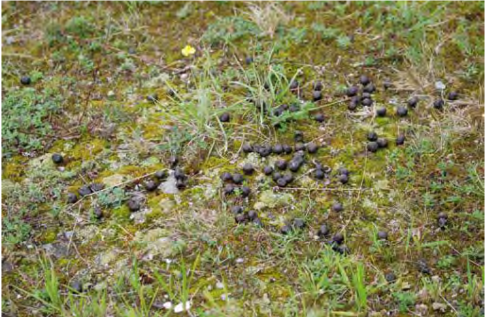
Abb. 5. Lebensraum von Myrmeleotettix maculatus mit Schafkot-Eintrag im August 2017. Trockenwiese TWW 8528 im Untersuchungsgebiet Rheinsand, Waffenplatz Chur.