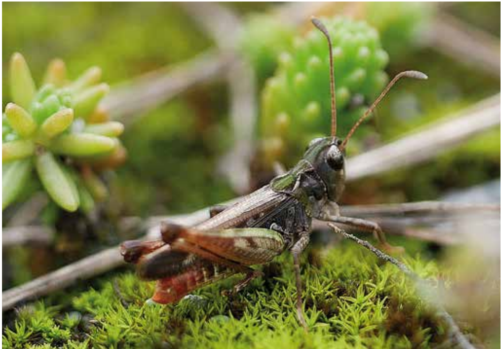
Abb. 1. Männchen von Myrmeleotettix maculatus (Thunberg, 1815). Untersuchungsgebiet Rheinsand, Waffenplatz Chur, 20.8.2017.