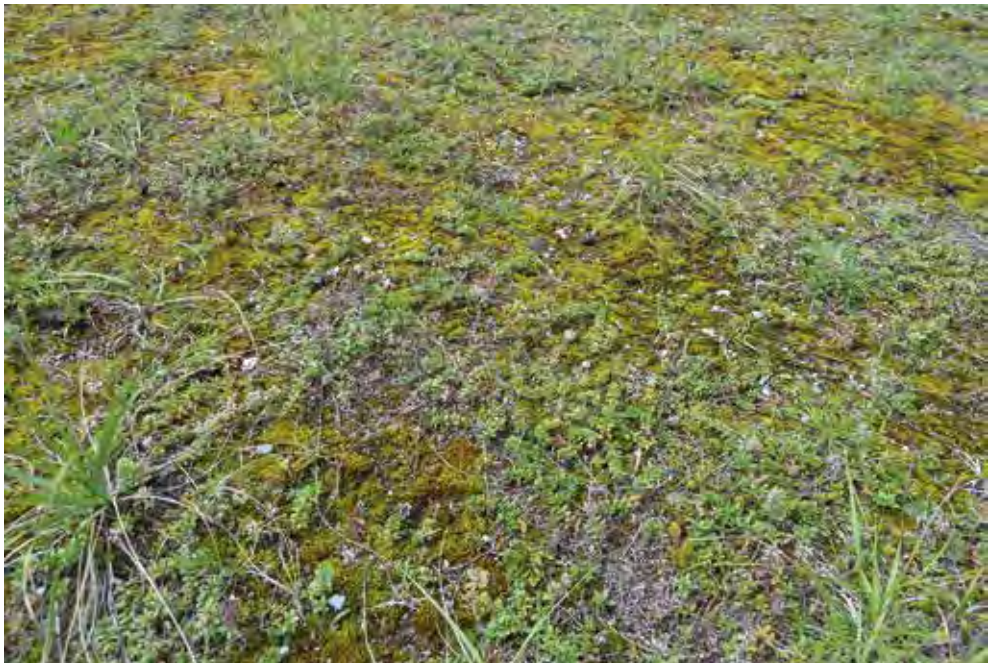
Abb. 4. Typischer Lebensraum von Myrmeleotettix maculatus im Untersuchungsgebiet Rheinsand, Waffenplatz Chur. Er zeichnet sich aus durch eine Mischung aus überwiegend niedriger Krautvegetation, Moosbewuchs und offenen Bodenstellen.