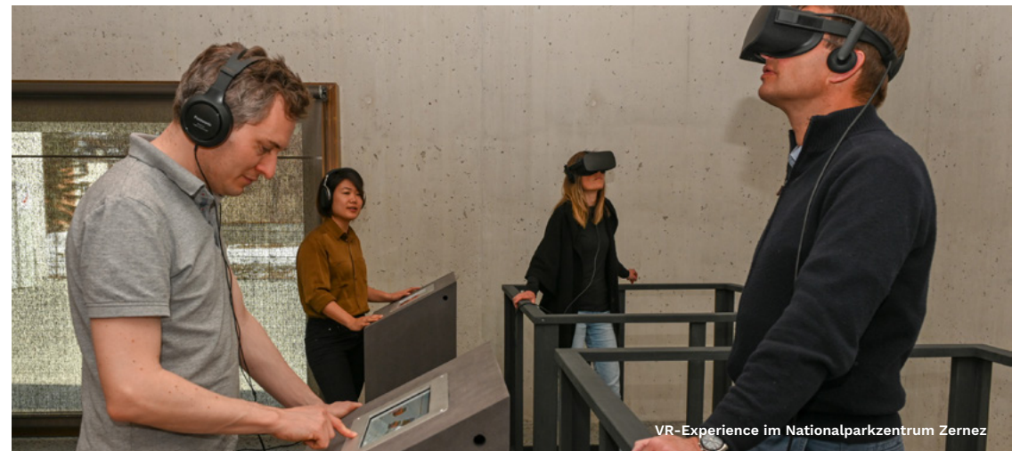
VR-Experience im Nationalparkzentrum Zernez