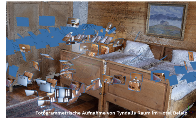
Fotogrammetrische Aufnahme von Tyndalls Raum im Hotel Belalp