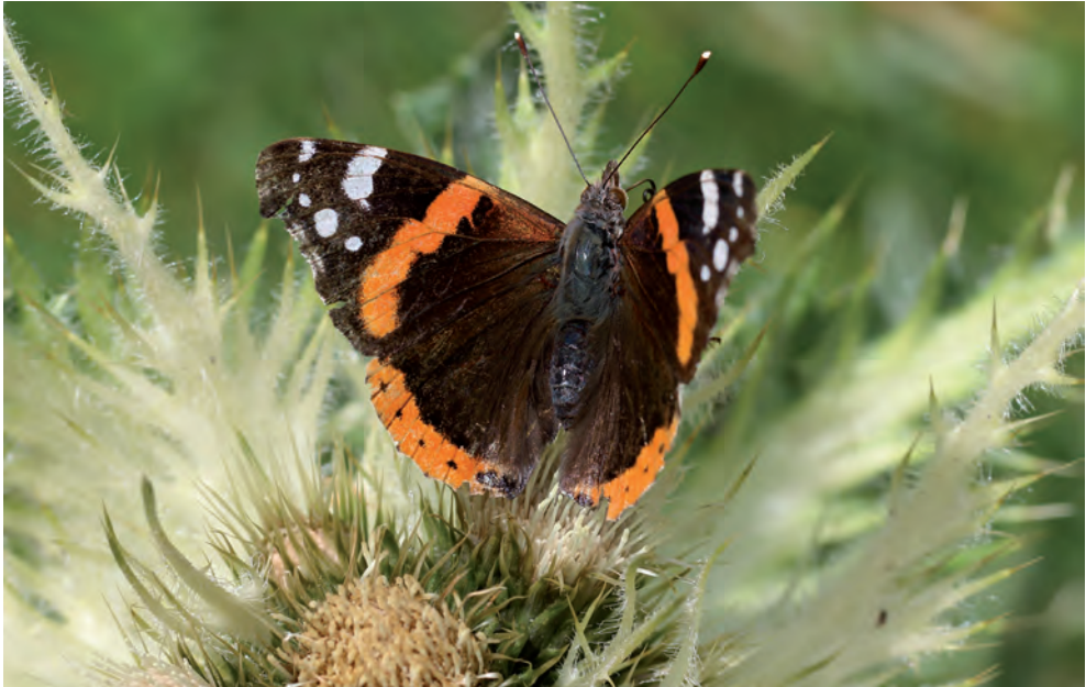
Ein schon etwas abgeflogener Admiral saugt an einer Distel.

Der Admiral Vanessa atalanta ist ein Wanderfalter, der jeden Frühling von Süden her in Mittel- und Nordeuropa einwandert. Im Herbst sind es die Nachkommen dieser Frühjahrs-Einwanderer, die zurück nach Süden fliegen. Um das Wanderverhalten und die ganzjährige Dynamik des Admirals besser zu verstehen, nutzen nun Forscher der Universität Bern sogenannte Citizen Science Beobachtungen aus ganz Europa. Dank der Unterstützung von über 40 Citizen Science Portalen aus über 20 Ländern sind bereits Hunderttausende Meldungen zusammen gekommen. Diese Fülle an Daten ermöglicht es, das räumlich-zeitliche Auftreten des Admirals in bislang nicht gekannter Auflösung zu verfolgen.